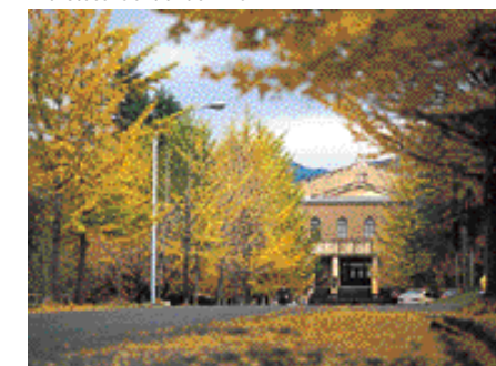
Biblioteca Central de Tenri