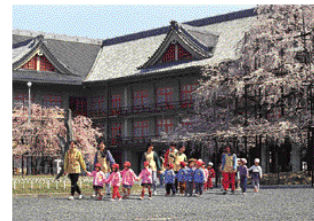
Ala Leste do complexo Oyasato-yakata . Os escritórios administrativos, cursos, alojamento dos seguidores, e várias instituições educacionais, culturais e sociais da Tenrikyo estão localizadas dentro do Oyasato-yakata .