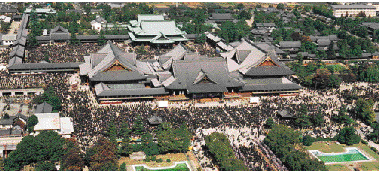
Vista aérea da Sede da Igreja Tenrikyo

Em Tenri, há várias instituições educacionais e sociais que incluem um orfanato e um hospital; e instituições culturais como uma biblioteca e um museu mundialmente famosos. Estas instituições são elementos auxiliares de trabalho para a realização do mundo pleno de alegria e felicidade, através do aprofundamento da compreensão mútua de toda a humanidade.